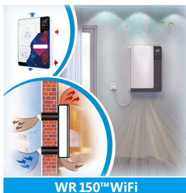
WR 150™ WiFi